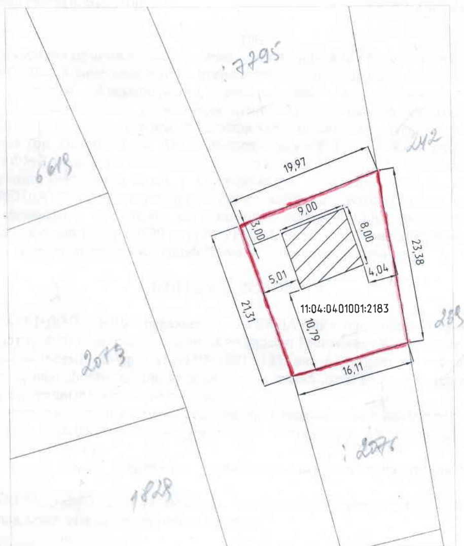
Схема планировочной организации земельного участка